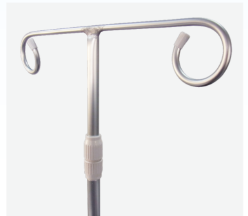
本体：アルミニウム、アルマイト仕上

mediinno medical care innovation 医療・福祉の現場を改善するメディーン