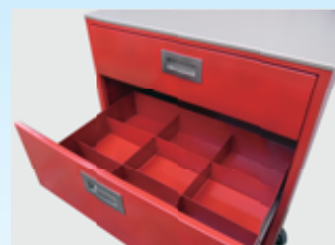
引出し2段目仕切り板セット