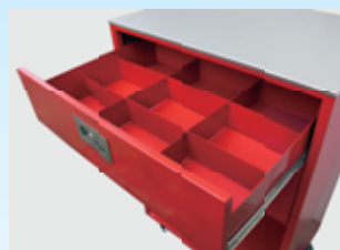
引出し1段目仕切り板セット